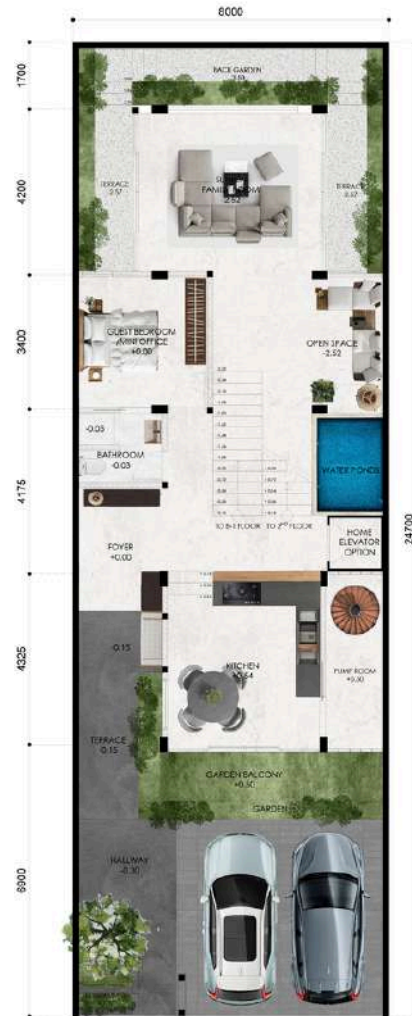
FLOOR PLAN 1ST