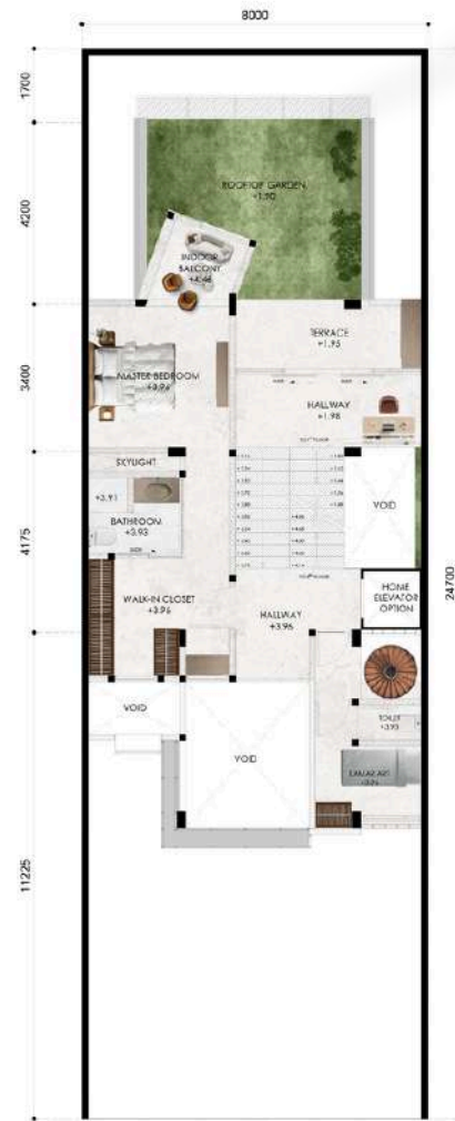
FLOOR PLAN 2ND