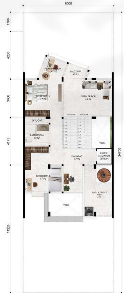
FLOOR PLAN 3RD